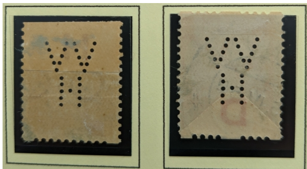
Afb. 3: twee VVH-poko's met papierlas

De Poko-machine kon maar één zegel tegelijk afsnijden en frankeren dus bij normaal gebruik was het onmogelijk om bijvoorbeeld een paartje te verkrijgen. Dit was alleen maar mogelijk als men de twee sleutels die nodig waren om het apparaat te openen en vaak in het bezit waren van de directeur en de postmeester tegelijk werden gebruikt om de Poko-machine te openen, dit om diefstal van de zegels tegen te gaan.