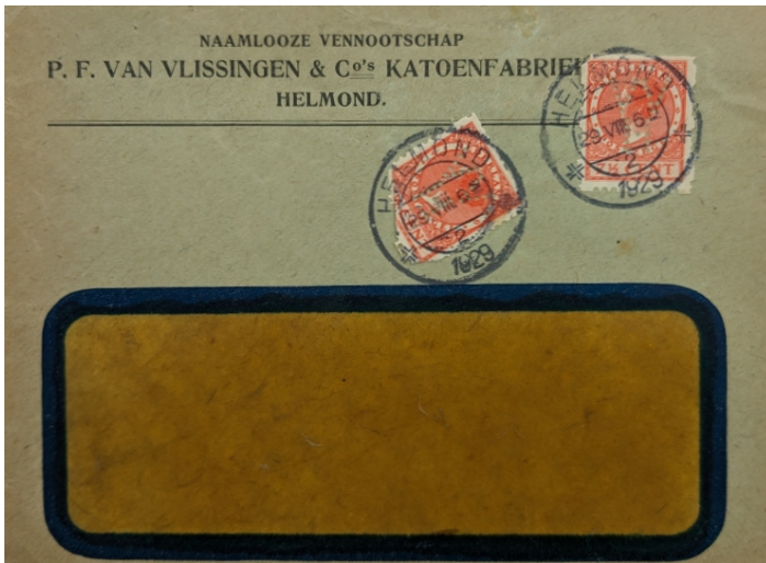
Afb. 8: Brief met twee poko's uit 1929

De eerste zegel is mooi in de rechterhoek van de brief geplakt door de Poko-machine, maar de tweede zegel ligt half schuin bijna midden op de brief en is ook onder aan de zegel dubbel gevouwen en zo ook op het postkantoor afgestempeld. Het is volgens mij onmogelijk dat de Poko-machine deze zegel zo op de brief heeft geplakt; de enige mogelijkheid die ik kan bedenken is dat de zegel niet goed bevochtigd is geweest en daarna door een medewerker van de postkamer er handmatig op is geplakt. Volgens mij was het niet mogelijk om twee zegels uit de machine op eenzelfde brief te plakken.