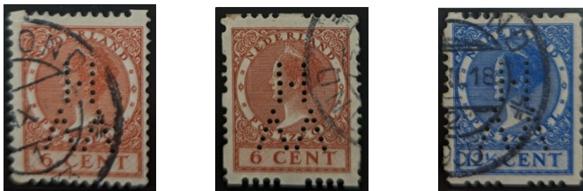
Afb. 2: drie kopstaande poko's VVH

De letters van de poko VVH staat voor : Van Vlissingen Helmond en de Poko-machine is in gebruik geweest van 1925 tot en met 1936. Van de poko VVH komen maar 14 verschillende zegels voor, maar deze zijn er wel in diverse variaties (met en zonder watermerk en in verschillende type roltanding)