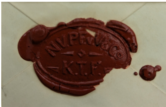
Afb. 11: Lakstempel met de letters NV, P, F, v, V, KTF.

Bij het versturen van brieven met een vertrouwelijke inhoud of met contanten was het in die tijd gebruikelijk om een brief te verzegelen met een lakstempel. Ook Van Vlissingen had een dergelijk stempel met de letters NV(naamloze vennootschap) P(Pieter) F(Fentener) v(van) V(lissingen) KTF (katoenfabriek). (zie afbeelding 11).