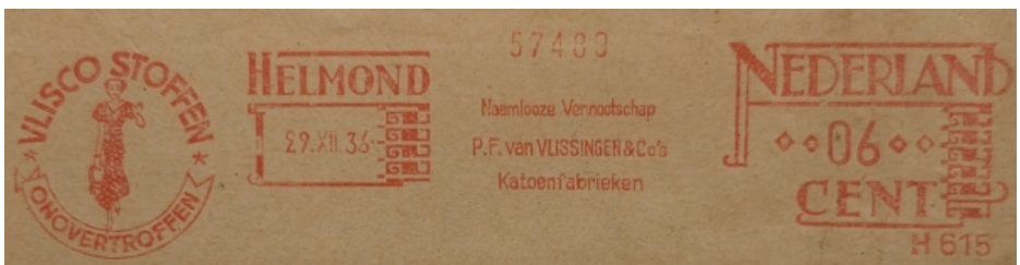
Afb. 9: roodfrankeerstempel Fa. Van Vlissingen

Vanaf 1936 is de firma Van Vlissingen overgegaan op de roodfrankeermachine (zie afbeelding 9)