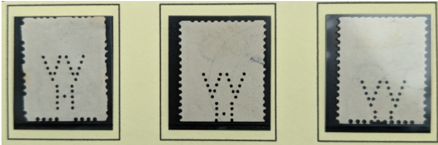
Afb. 6: verschoven stand van de perforatie

Doordat het transport van de Poko-machine wel eens niet goed stond afgesteld kwam het voor dat de perforatie die normaal altijd in de zelfde stand in de zegel staat verschoof (zie afb. 6).