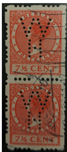
Afb. 4: paartje VVH-poko's

Een paartje is dan ook zeer zeldzaam (zie afbeelding 4).