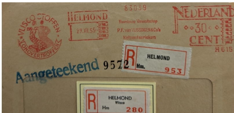
Afb. 9: roodfrankeerstempel met eigen aantekenstrookjes fa. Van Vlissingen

Nog later had het bedrijf ook de beschikking van eigen aantekenstrookjes (zie afbeelding 10).