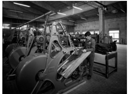
Afb. 5: Oldtannery

Dit bedrijf maakte sinds 1923 eerste kwaliteit leer