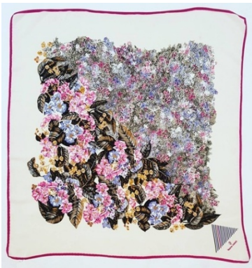
Afb 7: sjaal

Behalve de lederwaren ging het bedrijf ook damesmode maken sjaals en kleding onder de merknaam Nazareno Gabrielli Moda.